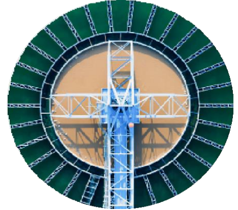
Şekil 1: Temsili resim

Üç veya daha az karbon atomuna sahip olarak tanımlanan ultra kısa zincirli per- ve polifloroalkil maddeler (USC-PFAS), çevrede yüksek hareketlilikleri, yüksek su çözünürlükleri ve organik maddeye düşük afinite göstermeleriyle karakterize edilir. Bu özellikler, çevresel sular, atıksular ve içme sularında yaygın olarak bulunmalarına katkıda bulunur. USC-PFAS ile ilişkili çevresel endişeler arasında kalıcılıkları, yeraltı suyu kirlenme potansiyelleri ve geleneksel arıtım yöntemlerine dirençli olmaları nedeniyle giderimde yaşanan zorluklar yer alır.