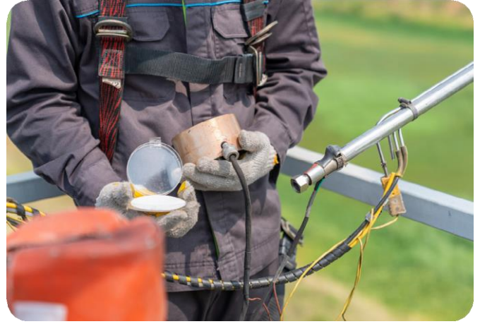
Şekil 4. OTM-50 kanister numunelemesi için saha personelinin örnekleme probunu ve giriş filtresini monte etmesi

Bu önemli yeni analiz hizmeti hakkında daha fazla bilgi için lütfen ALS Proje Yöneticiniz ile iletişime geçiniz.