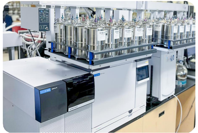
Şekil 5. OTM-50 için otomatik GC-MS/MS cihaz sistem