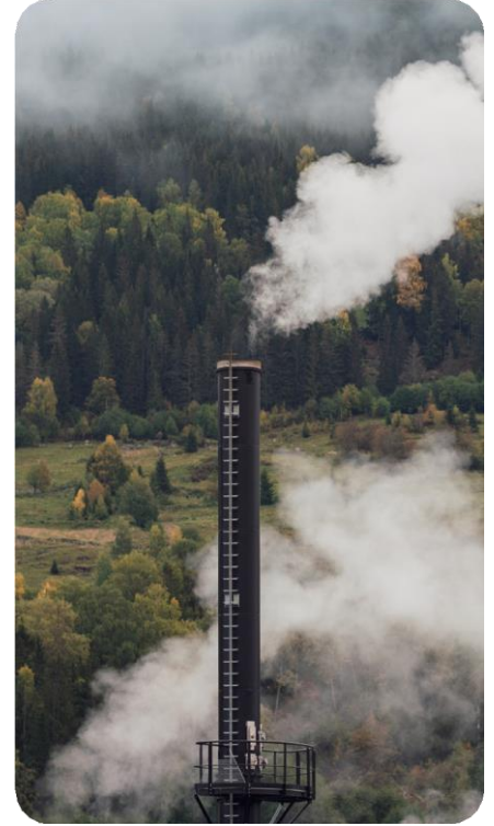
Şekil 1: Görsel Form

ALS, atmosferik PFAS analizleri için ABD Çevre Koruma Ajansı'nın (U.S. EPA) en güncel standart yöntemi olan ve ilk olarak Ocak 2024'te yayımlanan Other Test Method 50 (OTM-50) kapsamında havada uçucu PFAS analizini yakın zamanda hizmetlerine eklemiştir. OTM-50 yöntemi, kanister (gaz örnekleme kabı) ile numune alma ve GC-MS analizi kullanır ve özellikle diğer mevcut yöntemlerle analiz edilemeyen uçucu PFAS bozunma ara ürünlerinin varlığını belirlemek amacıyla atık yakma tesisleri gibi kaynakların baca emisyonlarını izlemek üzere geliştirilmiştir. Bu analiz türü, baca gazı emisyonları atmosfere verilmeden önce PFAS bileşiklerinin tamamen ortadan kaldırıldığı (mineralize edildiğinin) doğrulanmasını amaçlar. Öncül PFAS kirlenmelerinin parçalanması daha düşük sıcaklıklarda mümkün olsa da, çoğunluğu organoflorlu bileşiklerden oluşan ara ürünlerin tamamen yok edilmesi çok daha yüksek sıcaklıklar gerektirir. Tam mineralizasyon sağlanmadığında, yakma veya diğer bertaraf teknolojileri PFAS'ı tamamen yok etmek yerine farklı formlara dönüştürerek atmosfer yoluyla yeniden çevreye kazandırabilir. OTM-50 yöntemi ile emisyonların test edilmesi, PFAS'ın tamamen ortadan kaldırılmasını sağlayacak şekilde bertaraf süreçlerinin optimize edilmesine yardımcı olur; böylece PFAS'ın atmosfere taşınma döngüsünün kırılmasına ve sucul ile karasal ortamlardaki küresel PFAS ve organoflor yükünün azaltılmasına katkı sağlar.